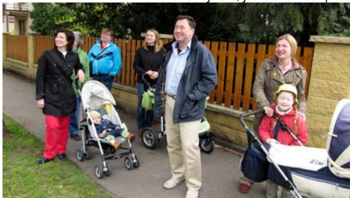
Členové Klubu přátel na výletě